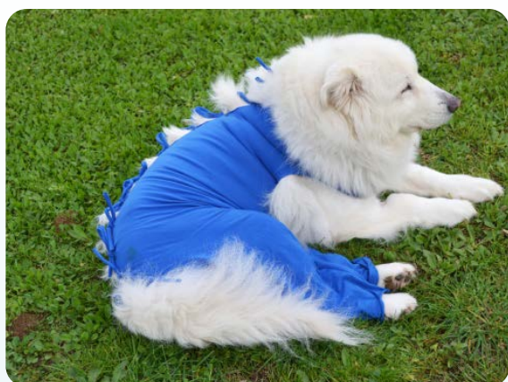
Anche per grandi taglie

Bendana è un bendaggio elastico studiato per coprire completamente le medicazioni nel post operatorio. Protegge la zona operata ma lascia all'animale assoluta libertà di movimento garantendo l'igiene in casa e la pulizia della cuccia. Bendana è una protezione fornita di lacciche permette di modularne tensione e lunghezza, conformandola a qualsiasi taglia e dimensione. È semplice da usare e facile da rimuovere anche durante i controlli. Realizzata in tessuto naturale di Jersey (≥ 90% cotone - 5÷10% Elastan) è morbida e traspirante. Bendana nasce come prodotto monouso, ma è eventualmente lavabile e sterilizzabile. Protegge i segni dell'intervento ed è un significativo simbolo di convalescenza.