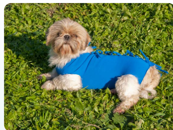
Morbida ed elastica